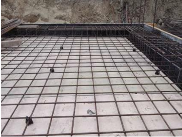
Şekil 1 Birbirini 90° kesen demir donatılar (hasır döşeme)

Bugün döşeme ahşap kalıpları ile demir donatıların imalatına devam edildi. Demir donatısı yerleştirilen kirişlerin arasına döşeme demirlerinin (hasır döşeme) imalatına başlandı. Döşeme demirleri birbirini 90° kesecek şekilde karşılıklı kirişlere paralel olarak yerleştirildi (Şekil 1). Döşeme demirlerine binen yük kirişlerin boyutları ile orantılı olduğundan; kirişlerle çevrili yüzeyin geometrisi kareye yakın ise tabana konulan demir donatıların ikisi de aynı boyutta (genellikle 8'lik demir tercih edilir) seçilirken, yüzey kareden farklı ise kısa olan kirişe paralel konulan donatılar bağlanırken daha kalın donatılar yerleştirildi (genellikle 10'luk demir tercih edilir). Bu şekilde farklı yüklere karşı çekme dayanımı maksimize edilip çatlak oluşumu minimuma indirildi. Aynı zamanda döşemelerin birbirine daha iyi kenetlenebilmesi için demirler kirişlerden sonra diğer demirler boyunca, boyunun dörtte biri kadar daha uzatılarak, yeterli aderans sağlandı (Şekil 2). Aynı amaçla perde kalıpla birleşen demirler de 90° kıvrılarak perde kalıp içine yerleştirildi. Döşeme donatıları tamamlandıktan sonra beton siparişi verildi (Şekil 3).