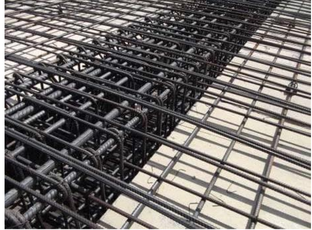
Şekil 2 Demir donatıların aderans için kirişlerden sonra boylarının dörtte biri kadar daha uzatılması