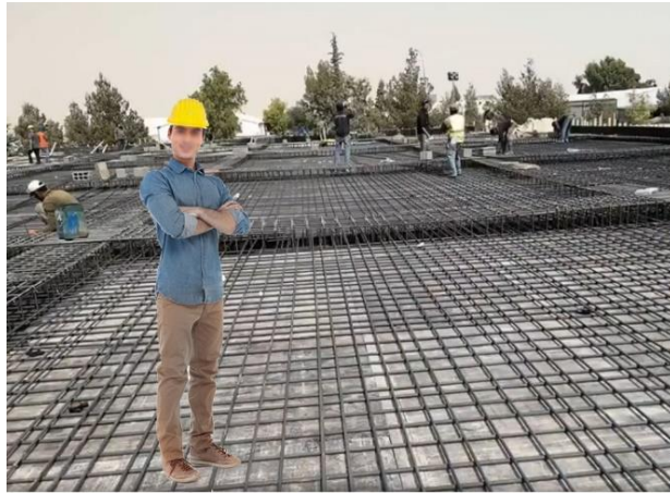
Şekil 3 Kiriş ve döşeme donatılarının tamamlanmış görüntüsü